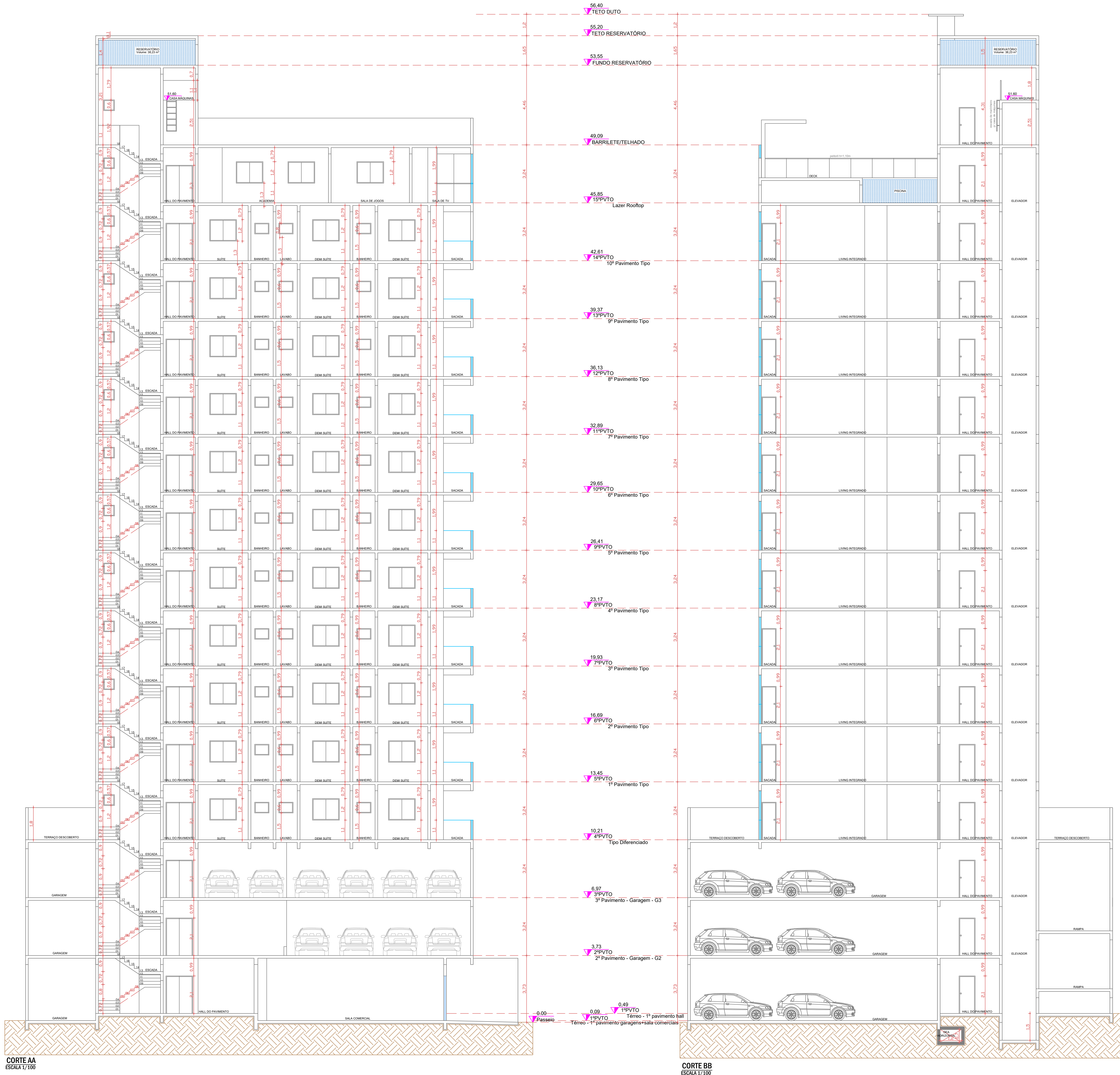
CORTE AA ESCALA 1/100